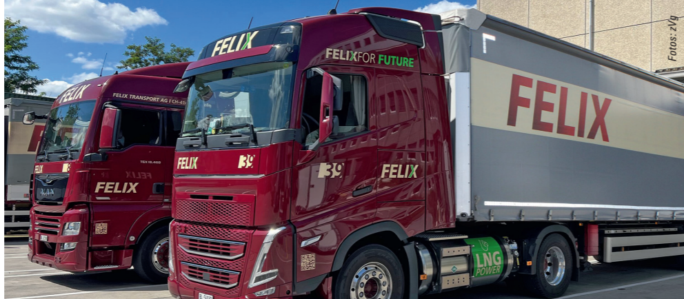
Zwei Zugmaschinen fahren seit Mai 2022 mit der LNG-Technik (Flüssigerdgas).