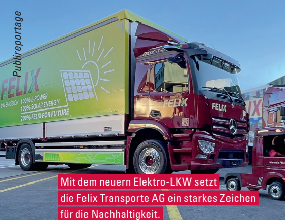
Mit dem neuern Elektro-LKW setzt die Felix Transporte AG ein starkes Zeichen für die Nachhaltigkeit.